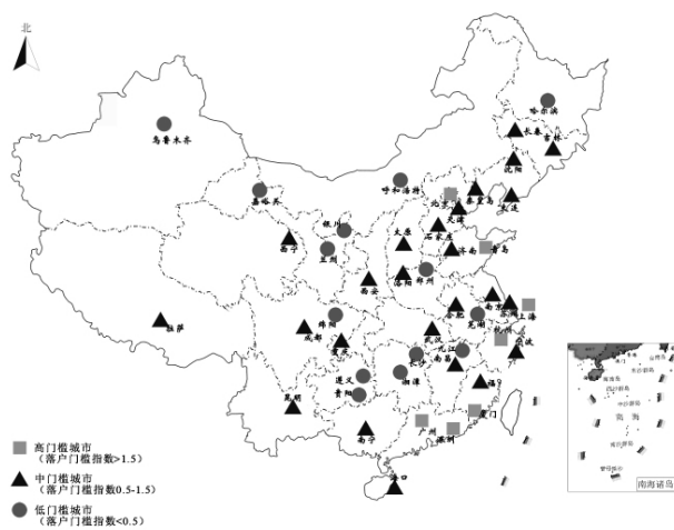
图1 投资落户门槛指数分布格局

从就业落户渠道(含普通就业和高端就业子渠道)看,向高素质群体倾斜是所有样本城市的共同特点,体现在对普通就业人群设立相当高的落户门槛,城市政府不愿意对外来人口有太多的财政承担。众多不具备大专以上学历、在城市无自有住房、从事体力劳动者几乎没有被提供机会获得城市户口。就业机会相对较多的沿海东部大城市设置